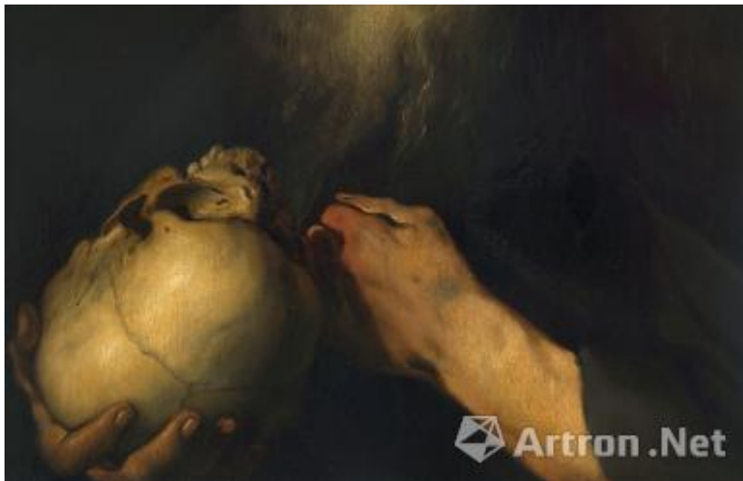
(佛兰德斯)彼得·保罗·鲁本斯(1577-1640) Peter Paul Rubens 《圣杰罗姆》 1603年 木板油画58.7X44.5cm