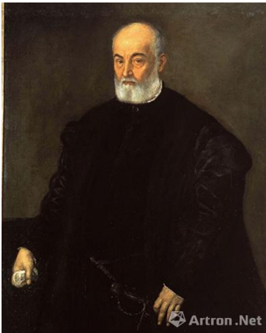
提香 Tiziano (1487-1576年) 《马尔卡托尼奥-莫罗西尼肖像》 1545—1550年 布上油画 124.5X97.5cm