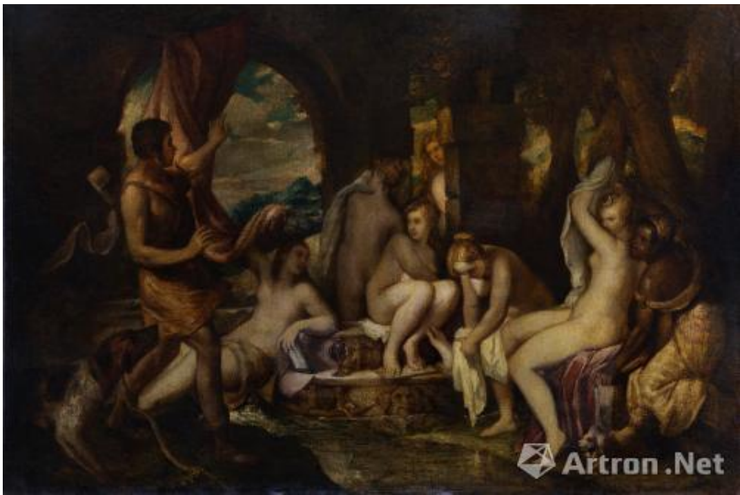
提香 Tiziano (1477-1576年) 《戴爱娜与阿克特翁》 1556-1559年 布面油画 102X153cm