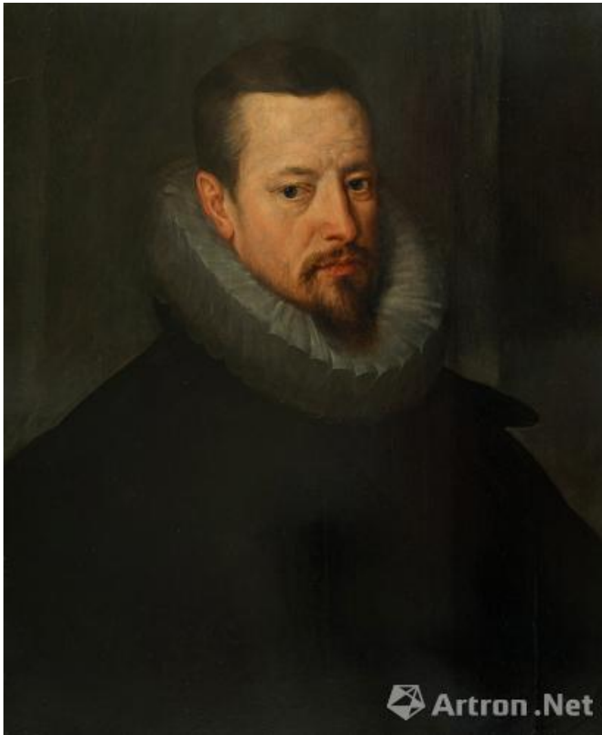
(佛兰德斯)彼得·保罗·鲁本斯(1577-1640) Peter Paul Rubens 《绅士肖像》 1615-1620年 木板油画 58X48cm