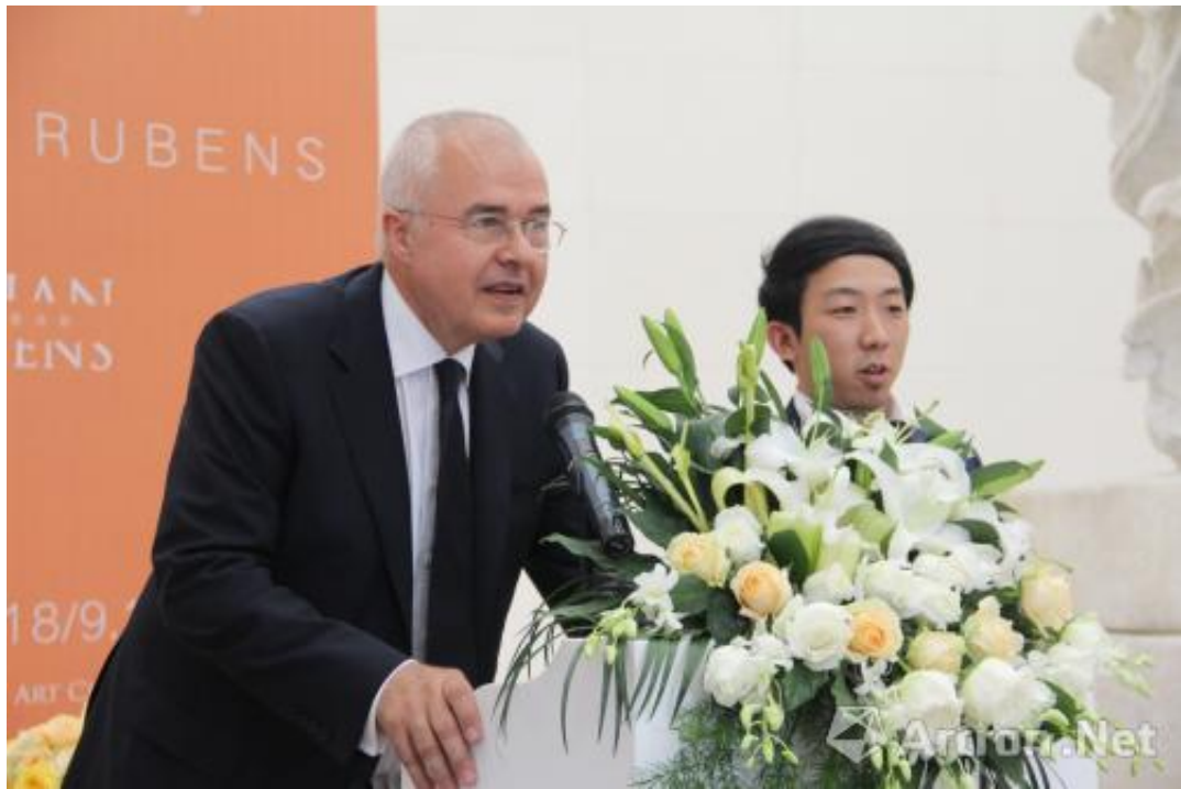
瑞士艺术品服务机构克劳奥蒂（左）致辞