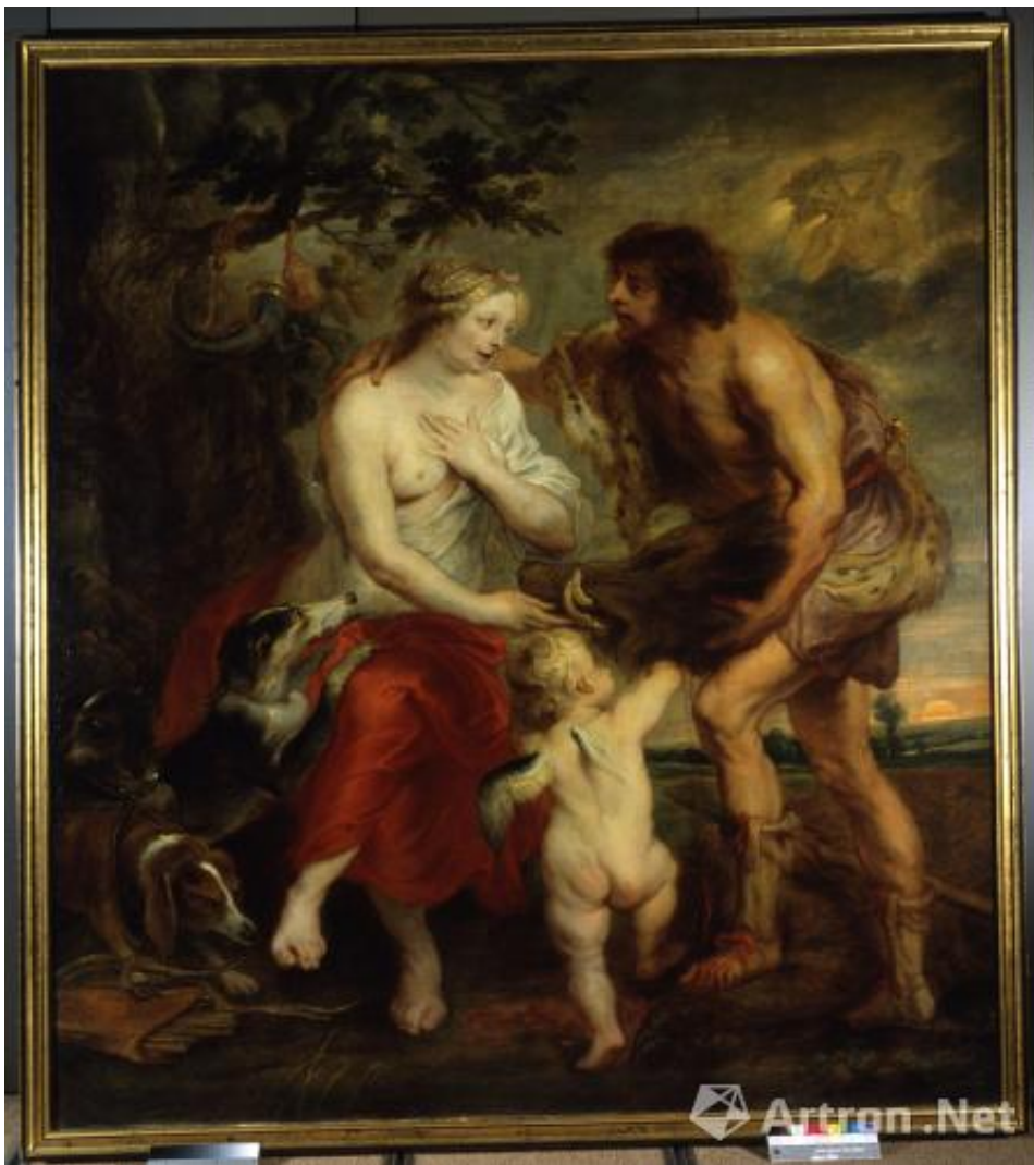
(佛兰德斯)彼得·保罗·鲁本斯Peter Paul Rubens (1577-1640年) 《阿塔兰特与泰莱亚戈》 1635年199X177cm