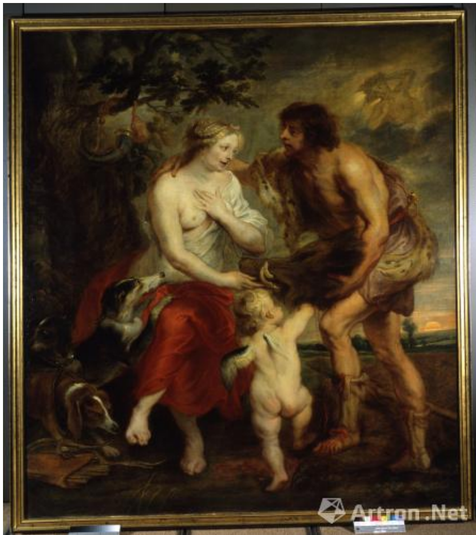
(佛兰德斯)彼得·保罗·鲁本斯Peter Paul Rubens (1577-1640年) 《阿塔兰特与泰莱亚戈》 1635年199X177cm