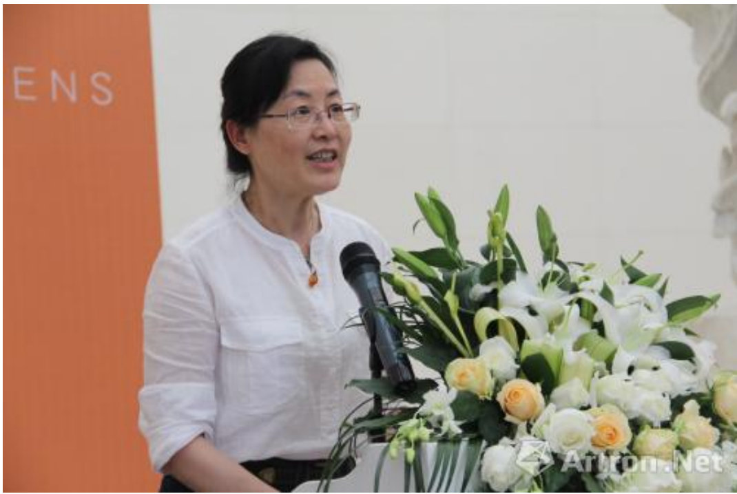
杭州市人民政府副市长陈红英