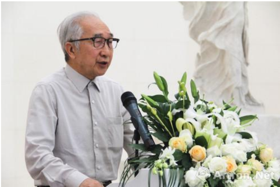
全国政协常委、著名油画家靳尚谊致辞