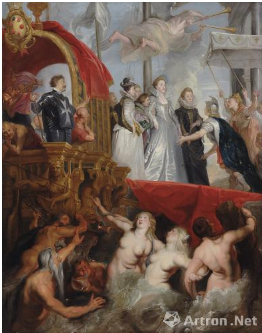
(佛兰德斯)彼得·保罗·鲁本斯(1577-1640) Peter Paul Rubens 《玛丽·德·美第奇抵达马赛》