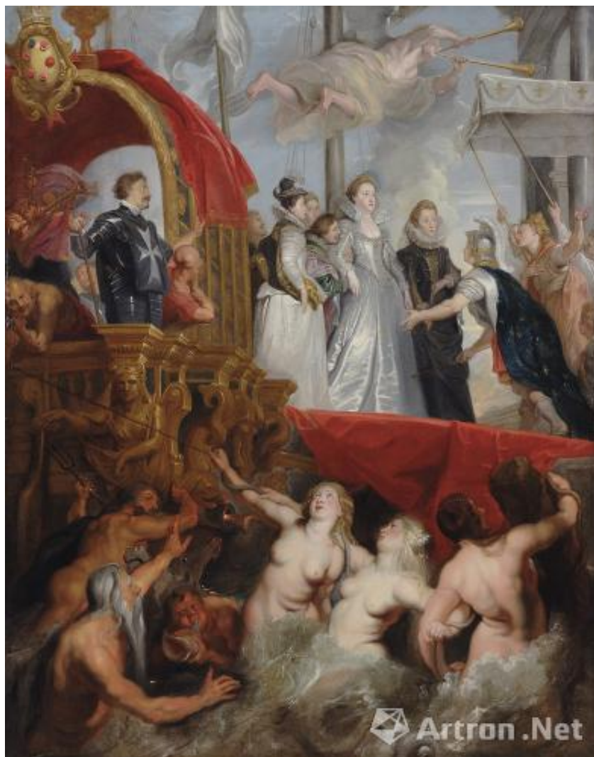
(佛兰德斯)彼得·保罗·鲁本斯(1577-1640) Peter Paul Rubens 《玛丽·德·美第奇抵达马赛》