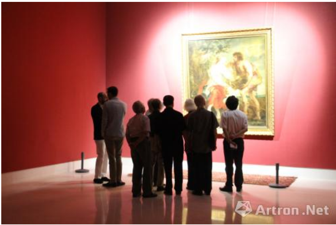
欧洲油画经典《提香与鲁本斯作品展》展厅内景