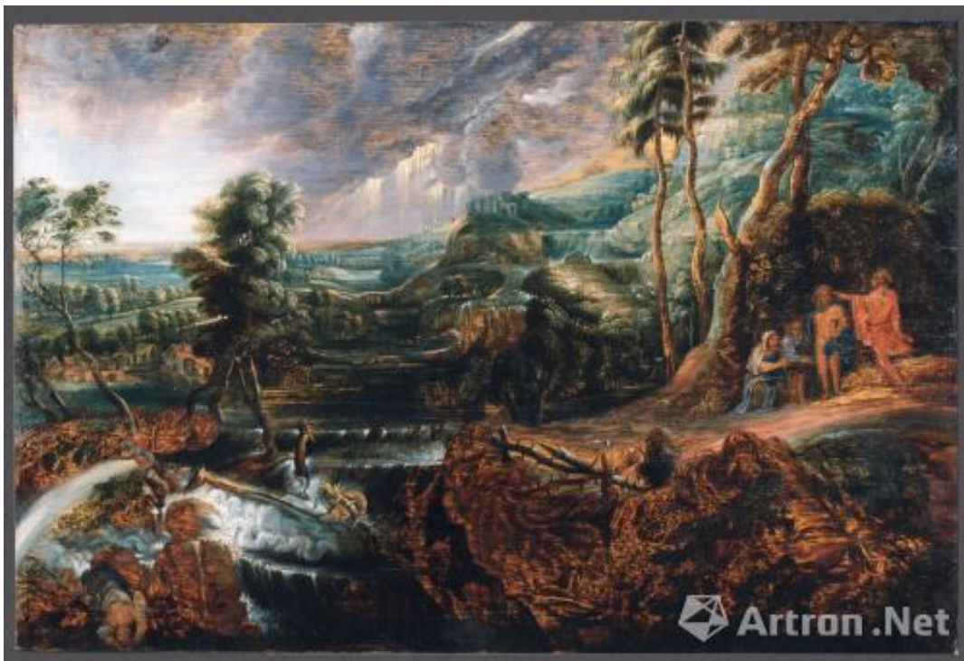
(佛兰德斯)彼得·保罗·鲁本斯Peter Paul Rubens (1577-1640年) 《费莱蒙和鲍西丝在暴风雨过后》 1620—1625年 木板油画 41.5X62cm