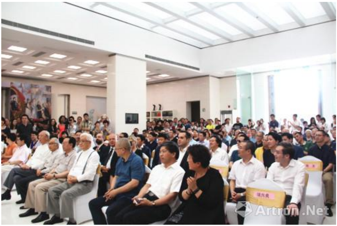
欧洲油画经典《提香与鲁本斯作品展》开幕式现场